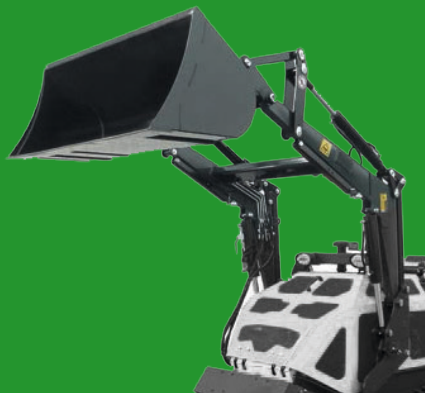
Loading bucket BAGGERLADER