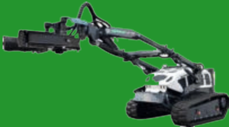
Vibrating head VIBRATIONSKOPF