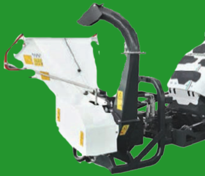
Organic shredder BIO-HÄCKSLER