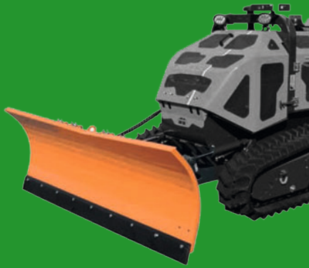
Snow plow SCHNEESCHILD