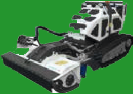
Grass cutter with conveyor GRASSCHNEIDER