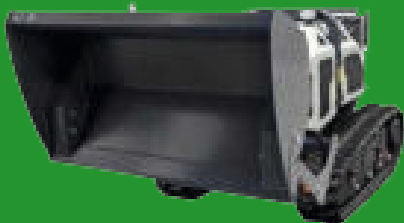
Frontal tip toe bucket FRONTSCHAUFEL