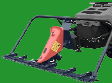
Hay bar MÄHWERK

Arbeitsbreite: 1,82 m; Doppelklingen-Schneidsystem; Parallelogramm-Sicherheitssystem; Gewicht: ca. 330 kg