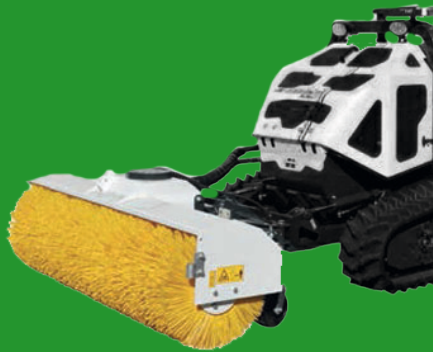
Rotary brush KEHRBESSEN